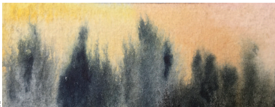
Les aquarelles de Jeff Benignus illustrent l'univers fantastique de L'Opéra imaginaire .

pour autant prendre en charge le récit. Son positionnement exact reste à préciser lors des prochains temps de travail.